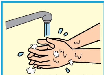
9 洗剤を十分な流水でよく洗い流す