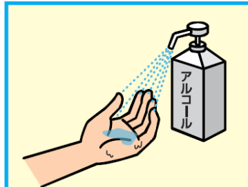
11 アルコールによる消毒