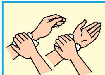
8 手首を洗う (内側・側面・外側)