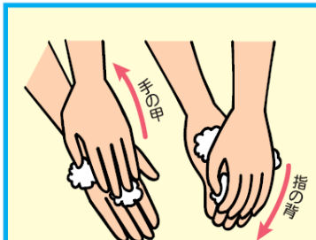
4 手の甲、指の背を洗う