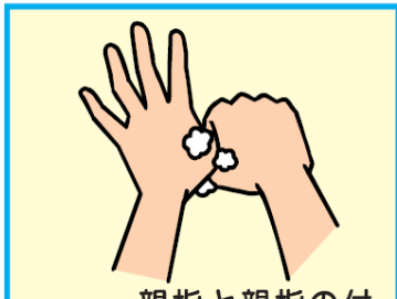
6 親指と親指の付け根のふくらんだ部分を洗う