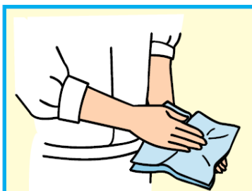
10 手をふき乾燥させる