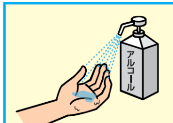
11 アルコールによる消毒