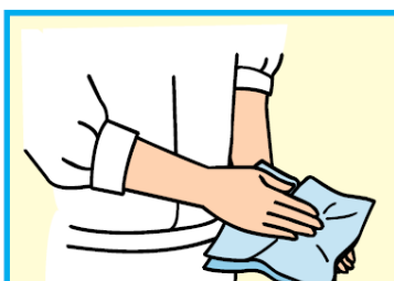
10 手をふき乾燥させる