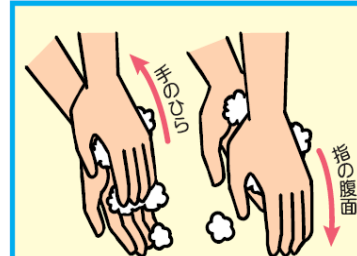
3 手のひら、指の腹面を洗う