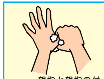
6 親指と親指の付け根のふくらんだ部分を洗う