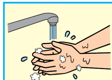
9 洗剤を十分な流水でよく洗い流す